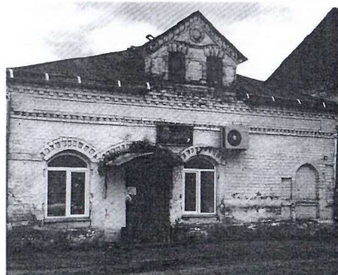
Фото 1. Главный фасад