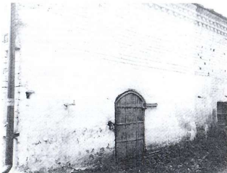
Фото 4. Фрагмент юго-восточного фасада