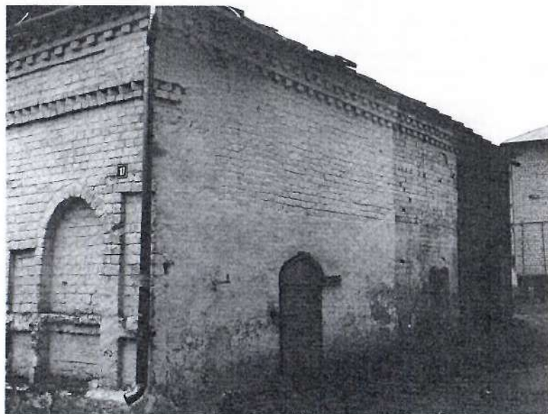
Фото 3. Юго-восточный фасад

Приложение №1 к охранному обязательству собственника или иного законного владельца Объекта, утверждённому приказом Охранкультуры Костромской области от 10.06.2020 № 7-2